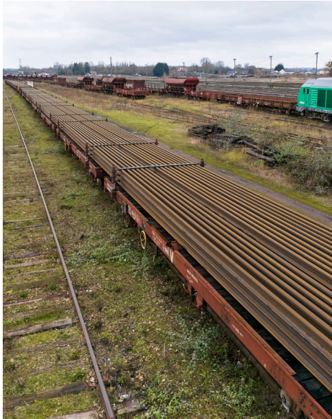
Transport du rail neuf qui viendra remplacer le vieux rail actuel